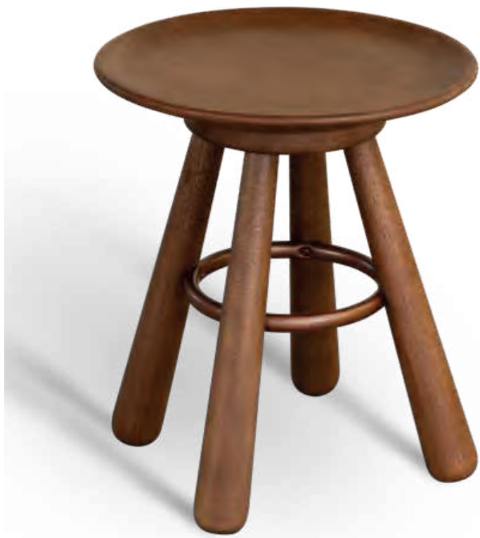
Un banquito encantador, una pieza muy versátil con trazos de brasilidad a través de sus formas. El detalle del aro metálico conecta las patas, aportando estructura y estabilidad a la pieza.